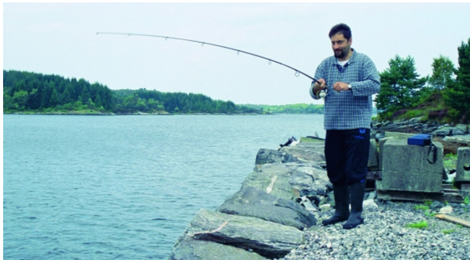
Die Eröffnung eines Aal-Festes beginnt in Feste typisch südnorwegisch: Man schleudert ein Makrelen-Paternoster weit hinaus ins Meer...