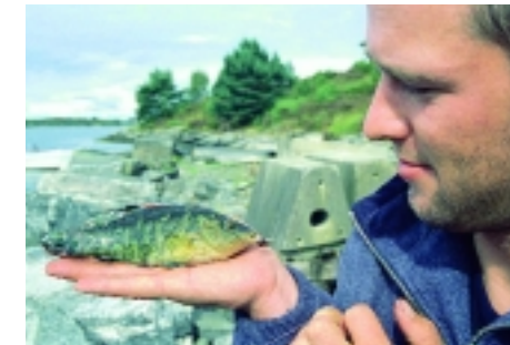
Ein Angelversuch auf Aal am Tage brachte vor allem Lippfische an den Haken.

auch größere Exemplare aus dem Bach, der das Gewässer speist, in den See. Und jetzt noch mal die Warnung an alle Aalang-