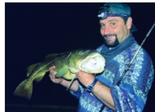
Wenn plötzlich andere Meeresfische beißen, ist der Aal-Spuk für diese Nacht leider vorbei. Aber so ein Dorsch ist doch auch nicht zu verachten, oder?

Infos/Buchung: Das Reiseziel Feste hat Din-Tur Deutschland im Programm ( www.din-tur.de , E-Mail: info@din-tur.de , Telefon: 04221-6890586).