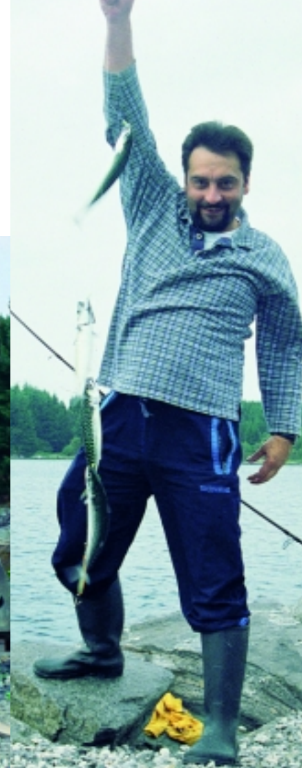
...und zieht erst mal den Ködervorrat für eine lange Aalnacht an Land...