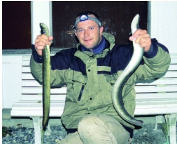
Warnung vor dem Dickaal: Jeder dritte Aal in Feste hat deutlich mehr als Gardemaß. Wer bei der Schnurstärke spart, spart am falschen Ende...

Am nächsten Tag hatten wir ein Problem. Nämlich 400 Tauwürmer im Kühlschrank - und niemand war bereit, mit ihnen zu angeln. Die mitgebrachten Würmer waren schlichtweg überflüssig, und damit auch das Risiko an der Grenze. Denn die Einfuhr von Tauwürmern nach Norwegen ist verboten, wie wir hinterher erfuhren. Schmuggeln lohnt also nicht - im doppelten Sinne. Denn ein Test ergab, dass sogar an einem nahen Süßwassersee ein frischer Makrelenfetzen der bessere Aalköder ist! Als wir uns am nächsten Abend an den Hintereingang des kleinen Supermarktes setzten, der sich unter den Ferienwohnun-