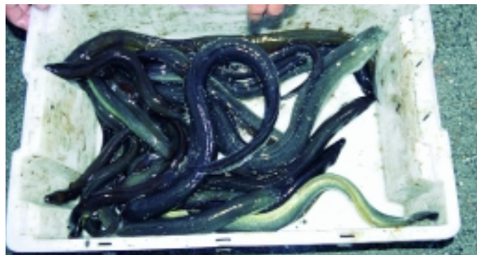
Der Fang eines einzigen norwegischen Aal-Abends. Mal ehrlich: Wann hatten Sie zum letzten Mal so ein Erlebnis in Deutschland?

Wichtig ist auch, in den Flutkalender zu schauen: Ebbe und Flut entscheiden über die Erfolgsaussichten. Am besten beißen die Aale, wenn das Wasser steigt. Steht es, lassen die Bisse nach. Wenn das Wasser wieder fällt, beißen sie wieder etwas besser, aber lange nicht so gut wie bei steigendem Wasser. Wer früher viel auf Aal geangelt hat, kann eigentlich auch im norwegischen Salzwasser alles so machen wie früher. Einfache Durchlaufmontagen fürs Grundangeln reichen. Ob Sie lieber mit Sarg- oder Birnenblei angeln, ist auch egal. Wichtig ist, zwischen Hauptschnur und Vorfach einen Einhängewirbel zu montieren, damit Sie nachher bei den Aalen, die tief ge-