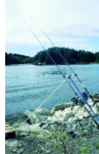
Aalangler brauchen in Norwegen kein Boot. Sie sollten aber ein robustes Dreibein einpacken, denn Erdspieße bekommt man zwischen den Felsen nicht in den Boden.

schluckt haben, die Vorfächer samt Haken schneller austauschen können. Die Aalbisse sind, wie gesagt „klassisch“. Nach dem Anschlagen muss die Rute sofort hochgerissen und schnellstmöglich eingekurbelt werden. Sie angeln nämlich auf einer steil abfallenden Kante mit vielen Versteckmöglichkeiten und Hindernissen. Je größer der Aal an der Leine, desto eher versucht er, da hinein zu entweichen. Aufgefallen ist uns auch, dass die Aale dort unempfindlich gegenüber dicker Schnur sind. Jedoch würde ich nicht über eine 0,45-er Monofile hinaus gehen. Monofil deshalb, weil dort relativ viele Steine und Muscheln am Grund liegen und sich die Geflochtene irgendwann durchscheuert. Wir haben dazu mit Karpfenruten in 2,75 lbs und