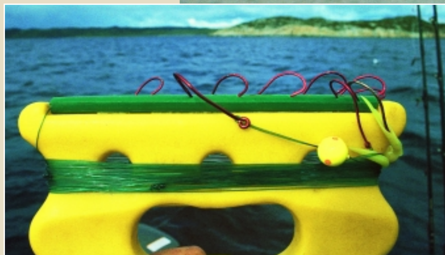
So knackt man die rote Delikatessenscheibe: Ein bis zu 20 Meter langes Paternoster-Vorfach. Alle zwei Meter sitzt ein Haken mit Leuchtperle.

Angler, Rotbarsch, Mitternachtssonne. Für die meisten Norwegenangler ein seltenes Erlebnis, denn sie angeln am Fisch vorbei.