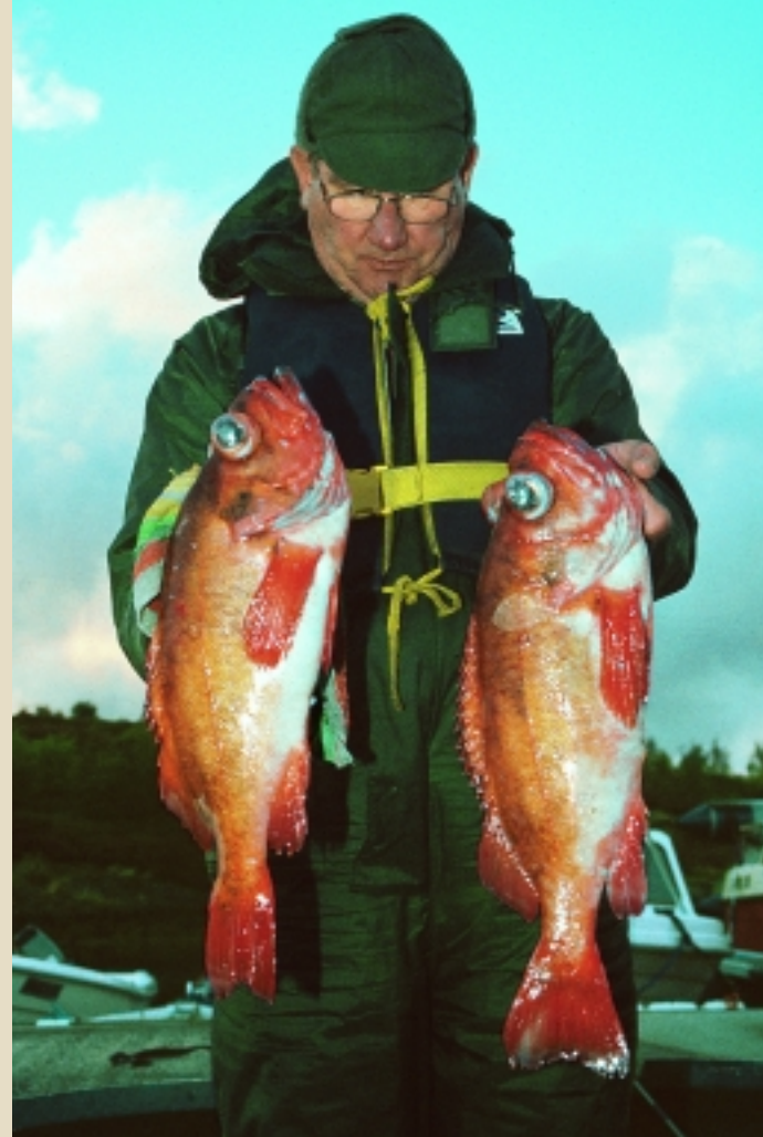
Vorhaben geglückt! Diese beiden Rotbarsche waren kein Zufallsfang.

Ein wenig Übung ist schon notwendig, um das Vorfach erfolgreich einzusetzen. Ein handliches Wickelbrett er-