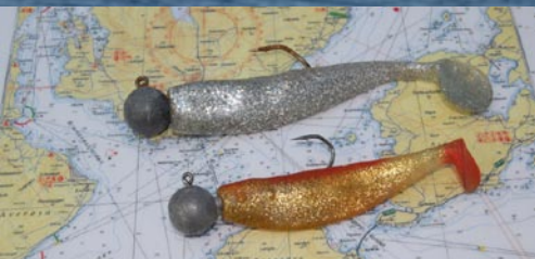
Mit Gummifischen läuft es an den flacheren Plätzen am besten.