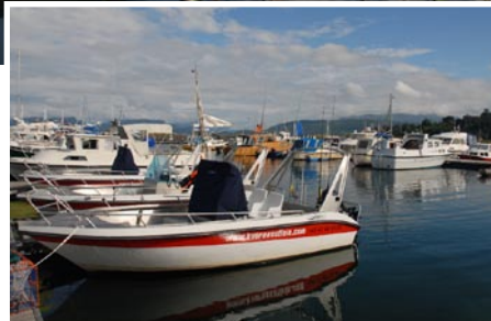
Gut ausgestattete Aluboote mit 50 PS Außenbordern bringen Sie zum Fisch.