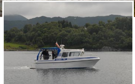
Nach Absprache sind mit diesem Boot Charterfahrten möglich.