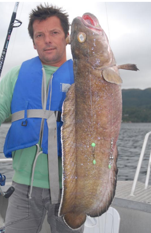
In Sichtweite zur Anlage Kvernes Utileie beißen stattliche Lumbs über 20 Pfund.

die 30 Meter Wassertiefe ein Versuch mit Naturköder auf Scholle und Schellfisch, mitunter greift sich auch mal ein Heilbutt den Köder.