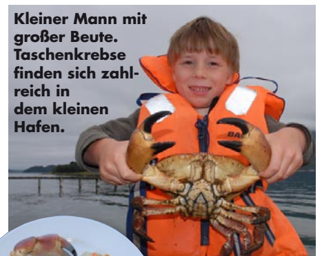
Kleiner Mann mit großer Beute. Taschenkrebse finden sich zahlreich in dem kleinen Hafen.