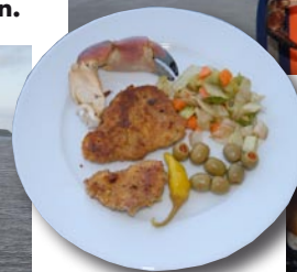
Was will man mehr: selbst geangelter Fisch und Krustentiere auf dem Teller.