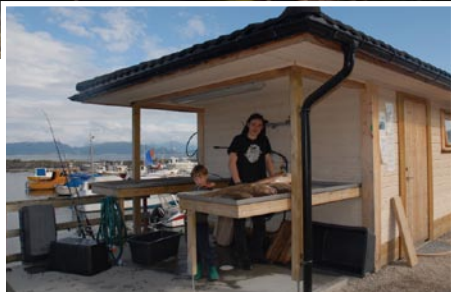
Das überdachte Filetierhaus bietet höchsten Standard.