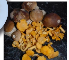
Ab Ende Juli wachsen Steinpilze und Pfefferlinge bei der Anlage.