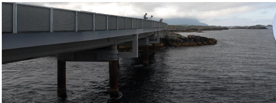
Angeln erwünscht: Von den Brücken werden vor allem Köhler und Makrelen erbeutet.