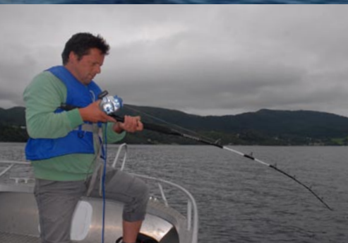
Eine Elektrorolle erleichtert das Kurbeln aus der Tiefe um einiges.