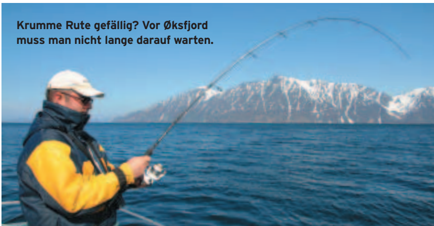
Krumme Rute gefällig? Vor Øksfjord muss man nicht lange darauf warten.