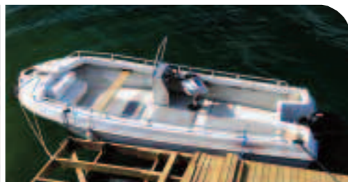
Günstigere und geräumigere Alternative: das offene 21-Fuß-Hansvik.