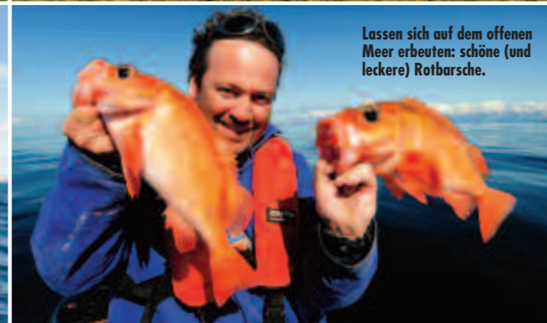
Lassen sich auf dem offenen Meer erbeuten: sch ne (und leckere) Rotbarsche.

m chte, ist in einer guten Fahrstunde auf der wirklich offenen See (da kommt im Westen nur noch Island!). Dank dem extrem sparsamen Suzuki-70-PSer halten sich die Kosten dabei in Grenzen. Kurzum: ein perfektes Revier f r echte Angelfreaks, aber dank der gesch tzten Lage auch f r Familien mit Kindern, die vieeel Fisch drillen m chten.