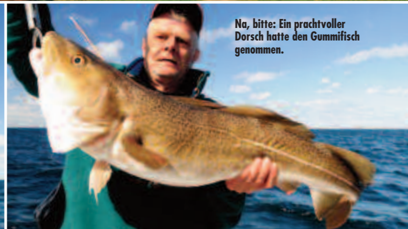
Na, bitte: Ein prachtvoller Dorsch hatte den Gummifisch genommen.