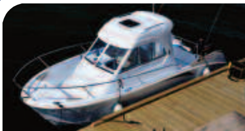
Traumschiff: die Beneteau 620 mit 70 PS; Marschfahrt: 20 Knoten.