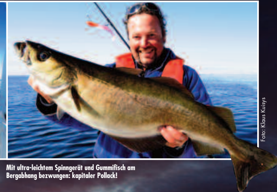
Mit ultra-leichtem Spinngerät und Gummifisch am Bergabhang bezwungen: kapitaler Pollack!