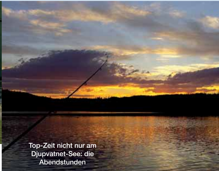
Top-Zeit nicht nur am Djupvatnet-See: die Abendstunden