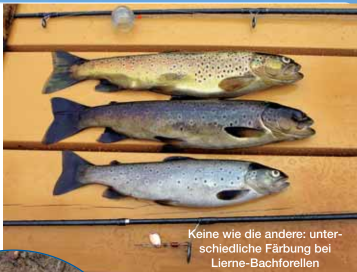
Keine wie die andere: unterschiedliche Färbung bei Lierne-Bachforellen