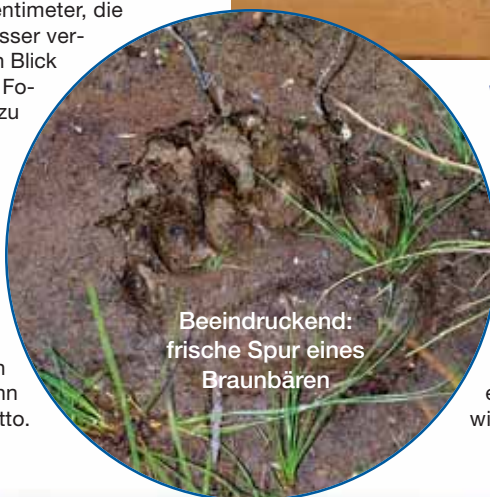
Beeindruckend: frische Spur eines Braunbären