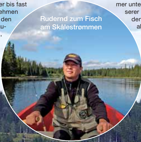
Rudernd zum Fisch am Skålestrømmen

Alle anderen Forellen setzen wir schonend zurück – der hervorragende Fischbestand im Lierne-Nationalpark soll keinen Schaden nehmen.