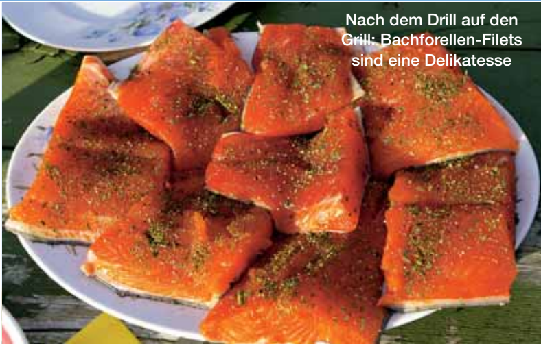
Nach dem Drill auf den Grill: Bachforellen-Filets sind eine Delikatesse