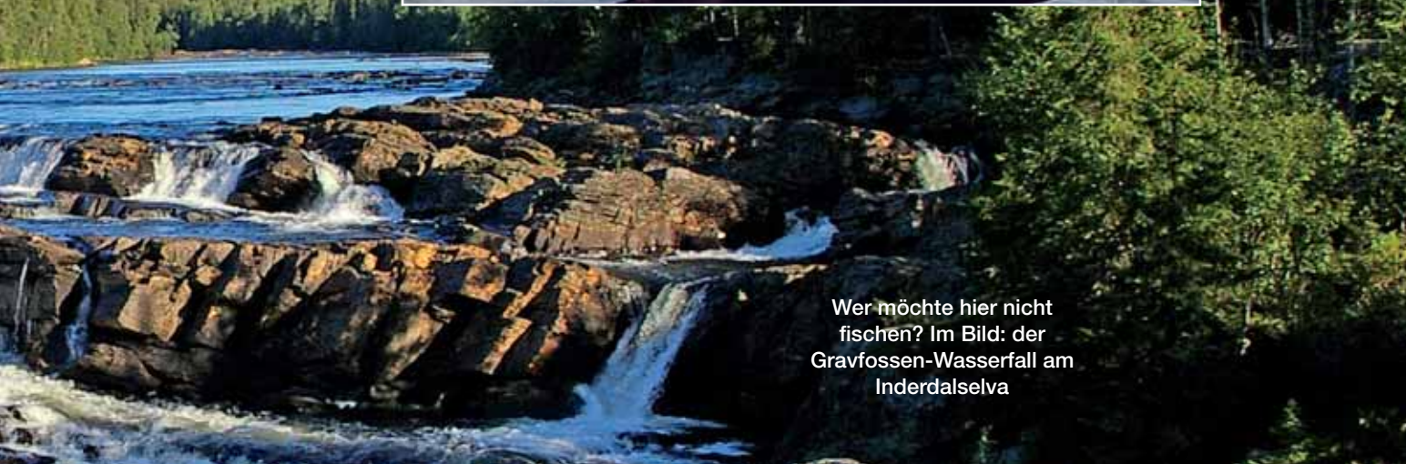
Wer möchte hier nicht fischen? Im Bild: der Gravfossen-Wasserfall am Inderdalselva